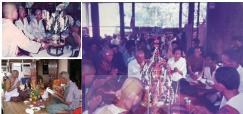
พิธีสู่ขวัญภาคและพานบายศรีแบบต่างๆ ในสังคมอีสาน

แล้วจะสวดเรียกขวัญให้กลับมาสู่ร่างของผู้รับการสู่ขวัญ จึงเรียกว่า พิธีสู่ขวัญ ทางอีสานใต้นิยมใช้พานบายศรี ซึ่งอาจทำอย่างเรียบง่าย จนถึงเป็นหลาย ๆ ชั้น ดังที่เห็นกันทุกวันนี้