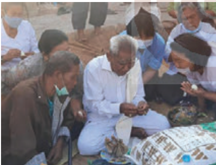
ทมตสูตพิจารณาकाงโก่และทำนายความอุดมสมบูรณ์ พิธีสูบขวัญข้าวในบุญคุณลานของบุคคลในชุมชน บ้านเมืองเตา อำเภอพยัคฆภูมิพิสัย จังหวัดมหาสารคาม

หรือทำงานบางอย่างเสร็จแล้ว การสูบขวัญไม่ว่าประเภทใดก็ตาม ย่อมมีจุดมุ่งหมายอย่างเดียวกัน คือ ต้องการให้ขวัญกลับมาอยู่กับ ตัวเจ้าของขวัญ มารับเครื่องสังเวย ในบายศรีด้วยความเชื่อว่า ขวัญ ช่วยทำให้เกิดความเป็นสิริมงคล และความสุขสบายแก่เจ้าของ ขวัญ หรือถ้าหากเป็นการสูบขวัญ สัตว์ สิ่งของ นอกจากเพื่อความ เป็นสิริมงคลแก่สัตว์ สิ่งของนั้น ยังผลให้สัตว์ สิ่งของนั้น นำ โชคลาภมาสู่เจ้าของด้วย