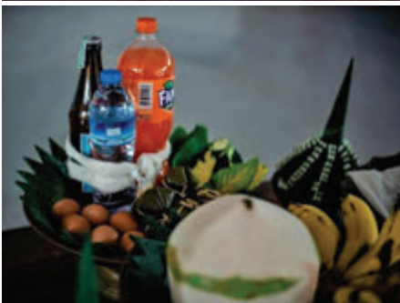
พานขวัญ หรือพานบายศรีพร้อมเครื่องค้าย พาเครื่องประกอบที่ใช้ใบโพธิ์ (ภาพจากวัดศรีธาตุ อำเภอเมือง จังหวัดยโสธร)

และลีลาที่ไพเราะ เพราะความ สำคัญของพิธีสู่ขวัญจะอยู่ที่การ สวดเป็นท่วงทำนอง ให้ผู้ร่วม พิธีได้ฟังเนื้อหาของ การเรียก ขวัญ ตามกาลละต่าง ๆ ที่ได้ รับเชิญ กล่าวได้ว่า พิธีสู่ขวัญ จะขาดค่าสู่ขวัญไม่ได้เลย ค่าสู่ขวัญจึงเป็นส่วนประกอบ ที่สำคัญ และมีความสัมพันธ์ กับพิธีสู่ขวัญอย่างแน่นแฟ้น