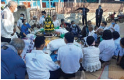
ชาวบ้านในชุมชนจะนำข้าวเปลือกของตนมาร่วมพิธี