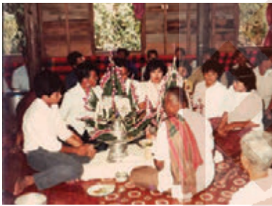
การสู่วิถีแต่งงานในพื้นที่ต่างๆ ภาพเก่าจากชุมชน