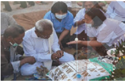
หลังพิธีสูบขวัญ ทมตสูตจะพิจารณาकाงโก่