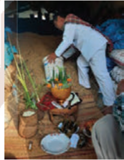
พิธีสู่ขวัญข้าว ในโอกาสนำข้าวเปลือกขึ้นเล้า บ้านเมืองเตา อำเภอยักษ์ภูมิพิสัย จังหวัดมหาสารคาม

จะเห็นได้ว่า ประเพณีของการสู่ขวัญในสังคมชาวอีสานแบ่งได้ ๒ ลักษณะ ลักษณะหนึ่งแบ่งตามกลุ่มผู้รับขวัญ ซึ่งแบ่งได้ ๓ กลุ่ม คือ การสู่ขวัญคน การสู่ขวัญสัตว์ การสู่ขวัญวัตถุสิ่งของ และอีกลักษณะหนึ่ง แบ่งตามโอกาสของการประกอบพิธีสู่ขวัญแบ่งได้ ๓ กลุ่ม คือ การสู่ขวัญคน เมื่อมีการเปลี่ยนแปลงไปในทางที่ดีงาม การสู่ขวัญคนที่มีความผิดปกติทางร่างกายและจิตใจ และการสู่ขวัญสัตว์ สิ่งของ เมื่อเสร็จจากการใช้งาน